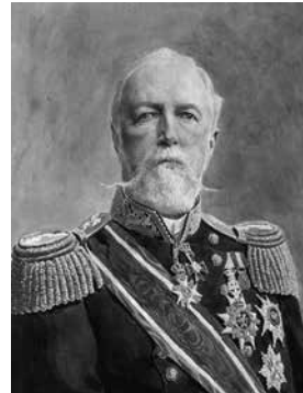
Kong Oscar den 2.

Henrik Ibsen beskrev de 434 år vi var i union med Danmark som "400 års natten" . Men faktum er vel at København utplyndret ikke Norge mere enn det almindelige Danmark ble utnyttet. Den norske eliten og mange kjente nordmenn som for eksempel Tordenskjold og Holberg fikk sin utdannelse og karriere i København og satte