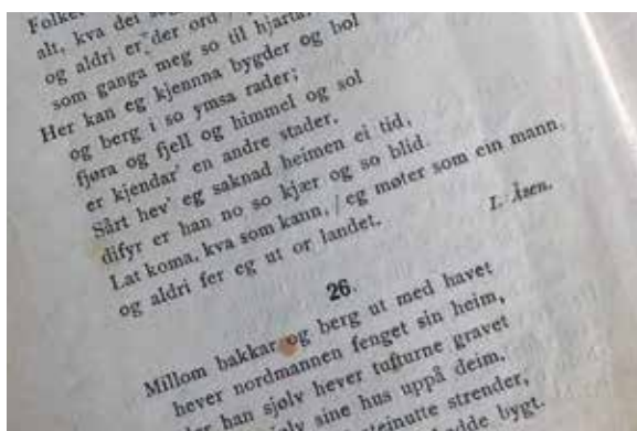
Millom bakkar og berg.

hvor innleggene fortrinnsvis skal være relatert til Norge, og gjerne med et humoristisk tilsnitt.