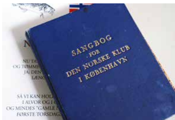
Sangboken og nubbevisa.