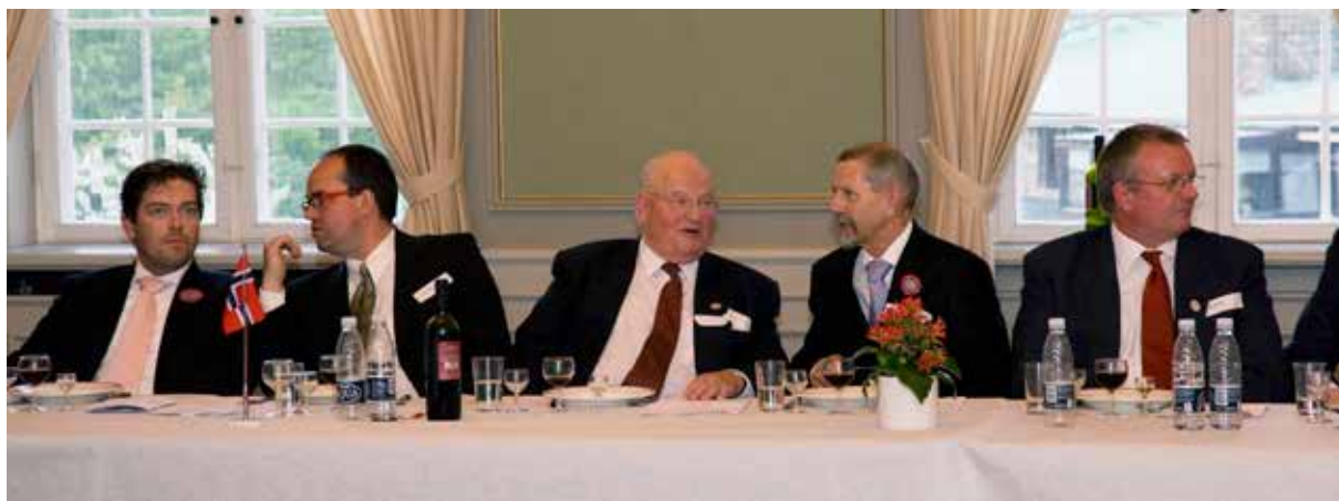
En frittalende og åpen forsamling.