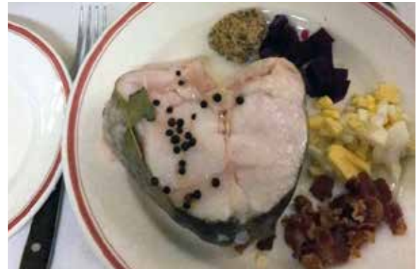
Torsk med tilbehør.

Deltagerne blir ønsket velkommen av formannen med ordene "Kjære landsmenn og venner av Den Norske Klub". Deretter blir det servert torsk i to omganger. Tilbehøret er vanligvis stekt flesk