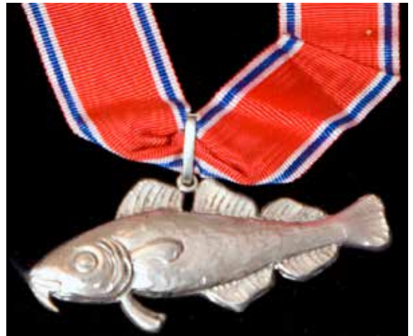
Sølvtorsk for kommandøren til å bære rundt halsen.