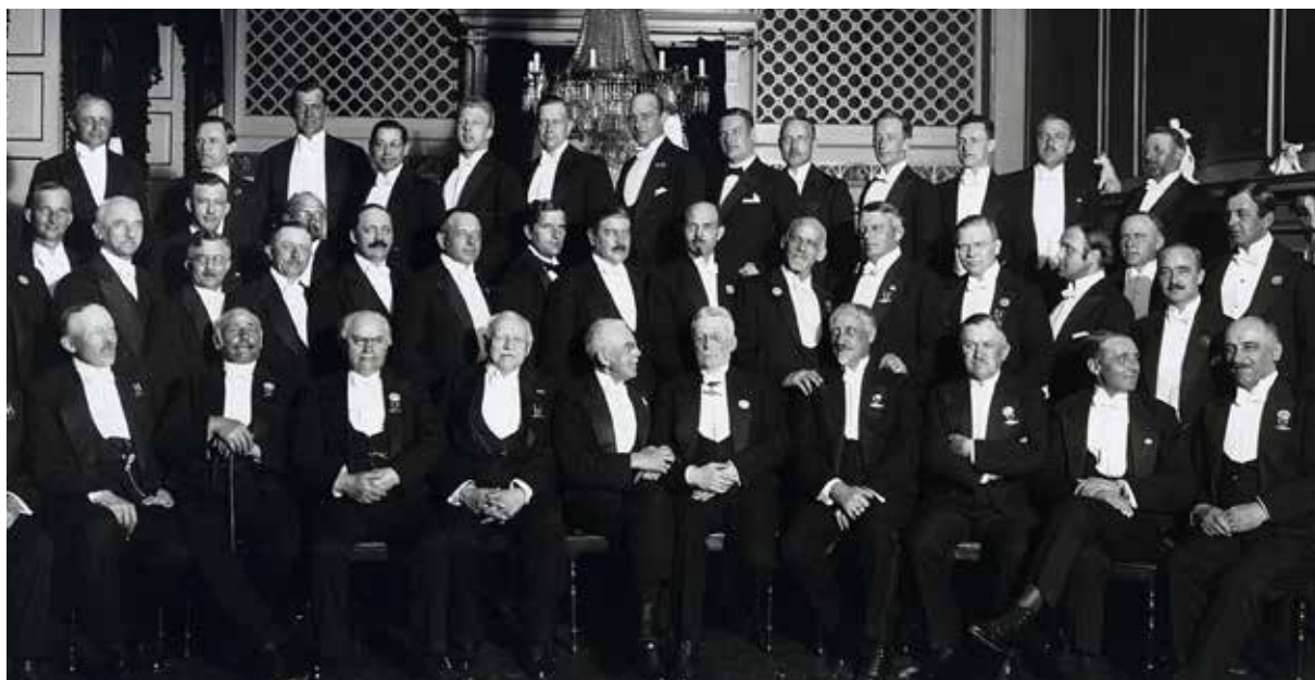
Norske Herreaftener i 1925.

debatter. Burde disse settes til side for et Norges Hus, eller skulle det kjøpes instrument? Det ble dog til et instrument.