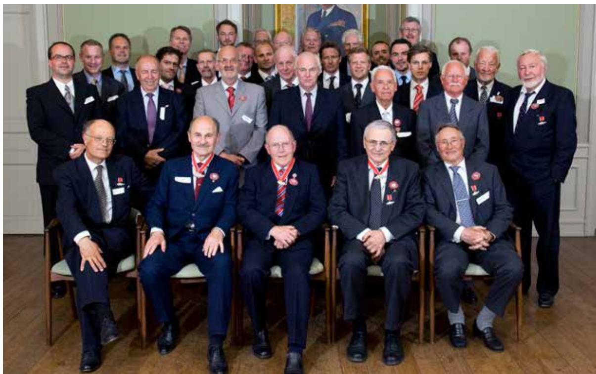
Bilde fra ordensmøte i 2009.

på råvaren vil avgjøre om torsken kommer på menyen; utfordringer med klimaforandringer og overfiskeri kan komme til å forkorte eller forsinke torskesesongen slik at oktobertorsken kan komme til å stå i fare.