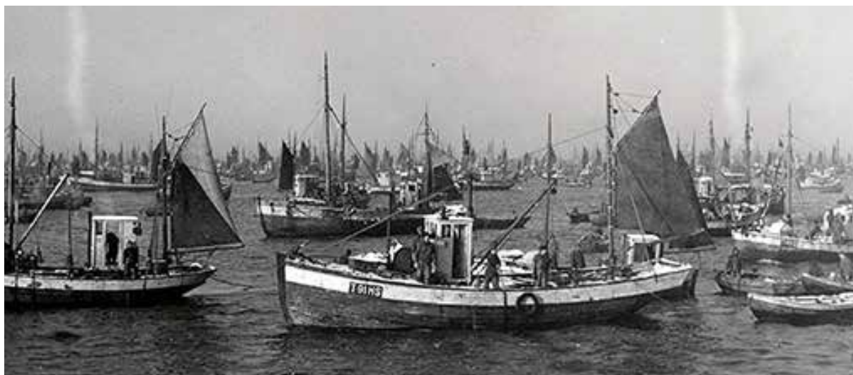
Lofotfiske i gamle dager.