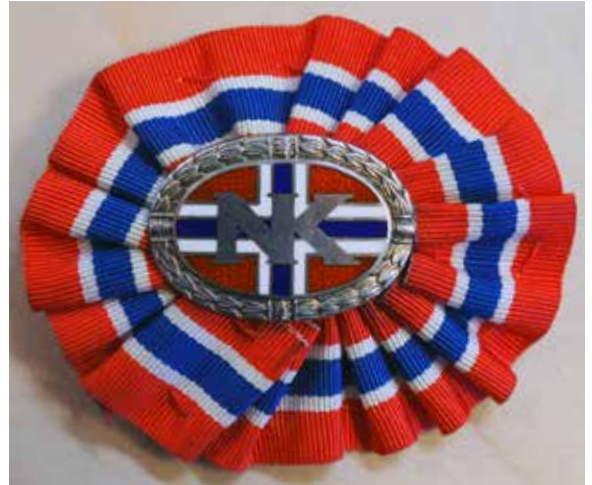
Rosett med sølvknapp.

Denne møteknappen ble senere utvidet med en kokarde (rosett) og deretter ei stjerne for hvert år man deltok i samtlige av sesongens middager, samt en større 10-års stjerne.